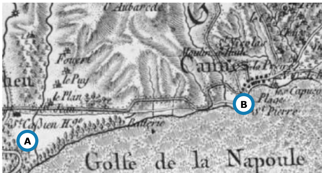
Carte de Cassini (XVIII e siècle) - BNF