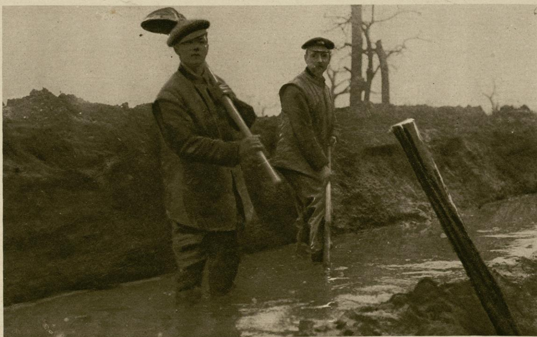
Départ d'une relève pour les tranchées. -- Soldats vidant un boyau noyé de boue

Le mauvais temps qui, depuis des semaines, sévit sur le front, a transformé tranchées et boyaux en véritables marécages et la neige est venue y ajouter sa note de tristesse. Rien de plus sinistre que ces paysages de mort, ravagés sans cesse par les