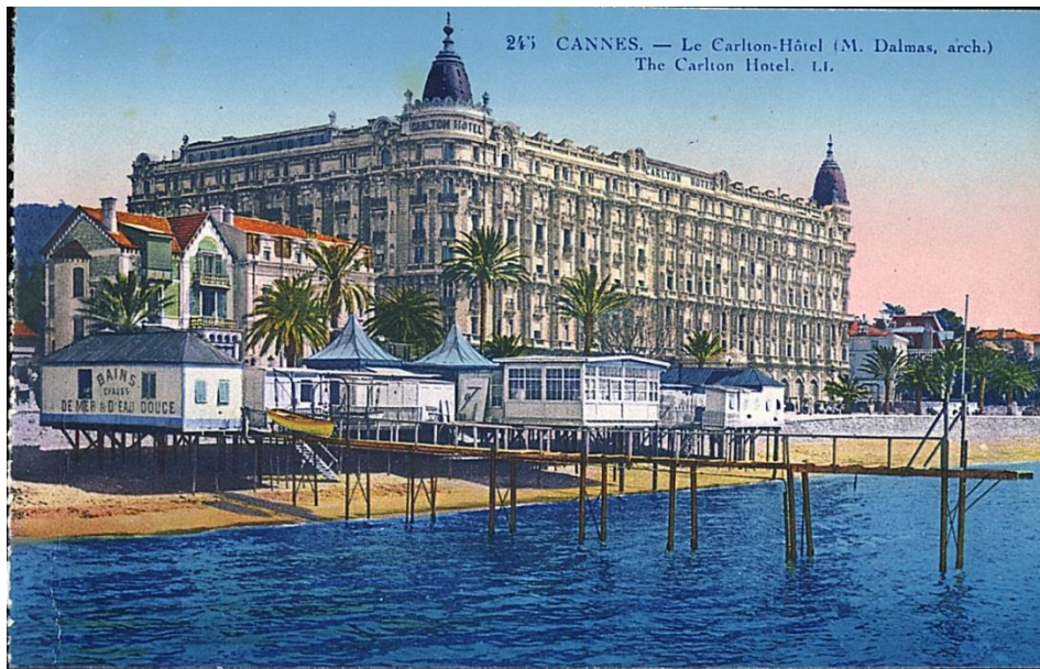
Cote 2Fi 1126