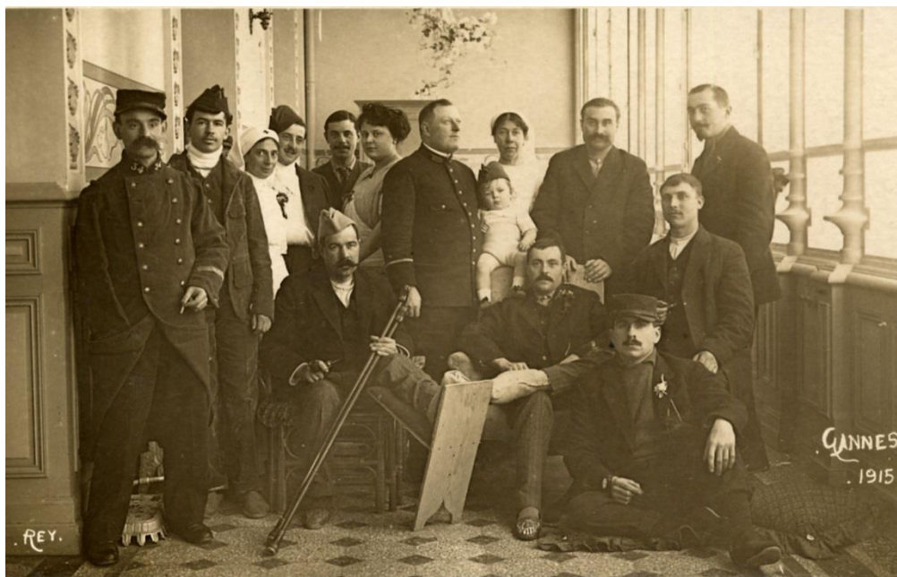
Cote 37S- Hôpital Gallia