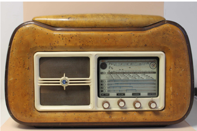
La radio des années 40- Photographie