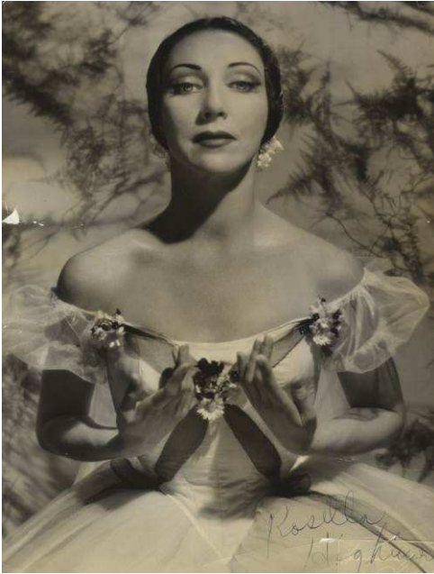
Portrait de Rosella Hightower - cote 16Fi139