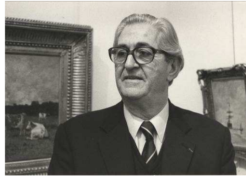
Albicocco Quinto, photographe et cinéaste cannois cote 16Fi144