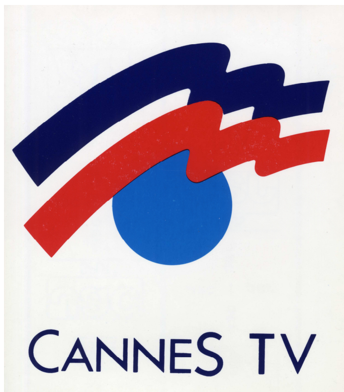
Logo Cannes TV - cote 76S16

Thème 6 : Une expérience originale : Cannes TV (vitrines 12 à 16).